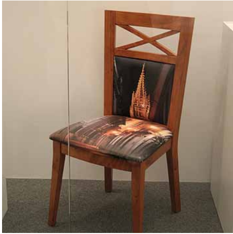
Miguel Lana Díaz de Espada "Silla de la Catedral de Oviedo"