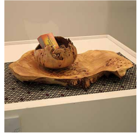
Giuseppe Ambrosioni "Alternativa a la estufa"