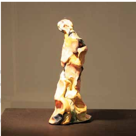
Klara Konkoly-Thege "Individuo"