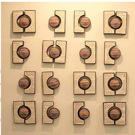
Cecile Brillat "Media Manipulation"