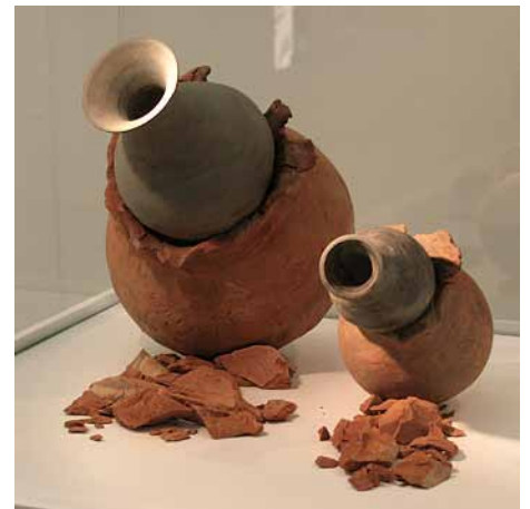
Rita Prendes "Partus"