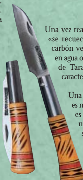
FERMÍN LOMBARDO RÍOPEDE (ABRAÍDO)

Una vez realizado este proceso, «se recuece» sobre brasas de carbón vegetal y «se templá» en agua o aceite. El agua caliza de Taramundi mejora las características del templado.