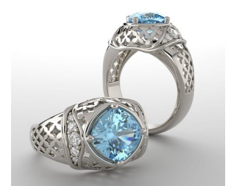
Ejemplo de RENDER V-RAY