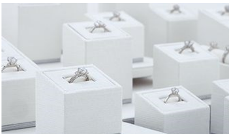
STULLER ofrece una colección de 120 ejemplos de PRE-DISEÑO